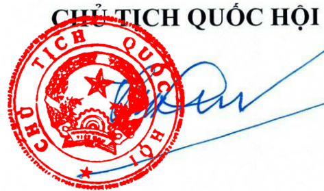
Trần Thanh Mẫn

Nghị quyết này được Quốc hội nước Cộng hòa xã hội chủ nghĩa Việt Nam khóa XVI, Kỳ họp thứ Nhất thông qua ngày 24 tháng 4 năm 2026.