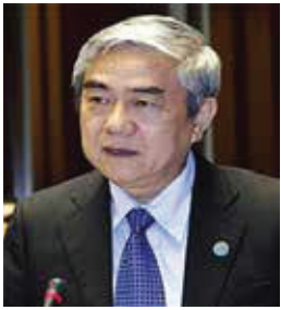
TS. Nguyễn Quân Nguyên bộ trưởng Bộ KH&CN Chủ tịch VAA