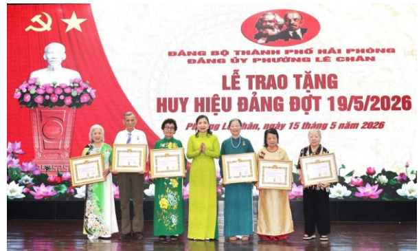
Thường trực Đảng ủy phường trao Huy hiệu Đảng cho đảng viên