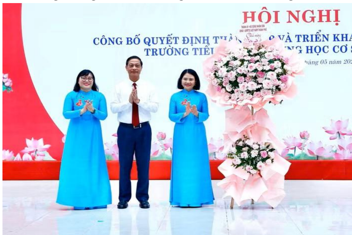
Đ/c Đỗ Mạnh Hiến - Phó Bí thư Thường trực Thành ủy tặng hoa chúc mừng nhà trường

Sáng ngày 19/5, Đảng ủy, Hội đồng nhân dân, Ủy ban nhân dân phường Lê Chân tổ chức Hội nghị công bố Quyết định thành lập Trường và Quyết định thành lập tổ chức Đảng Trường Tiểu học và Trung học cơ sở Kênh Dương.