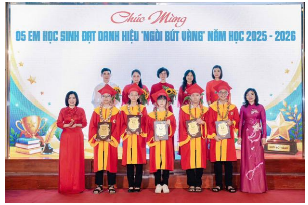
Thường trực Đảng ủy phường dự lễ tổng kết năm học 2025 - 2026 tại các trường học trên địa bàn phường

* Công tác y tế: Xây dựng Kế hoạch phòng chống bệnh truyền nhiễm 2026 trên địa bàn phường Lê Chân; Kế hoạch khám sức khỏe định kỳ, sàng lọc một số bệnh thường gặp cho người cao tuổi theo Nghị quyết số 49/2025/NQ-HĐND năm 2026.