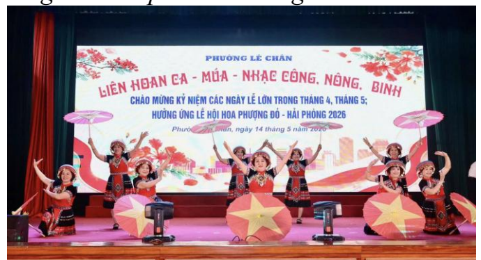
Chương trình Liên hoan Ca - Múa - Nhạc Công - Nông - Binh năm 2026