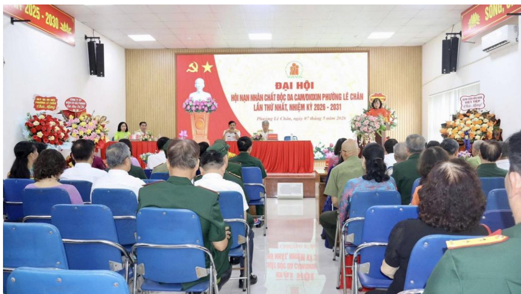
Quang cảnh Đại hội

Với tinh thần “Phát huy truyền thống - Nâng cao trách nhiệm - Lan tỏa yêu thương”, Đại hội đã thống nhất phương hướng nhiệm kỳ mới: Hoàn thiện tổ chức chi hội tại các tổ dân phố; phấn đấu 100% nạn nhân được chăm lo vào các dịp lễ, Tết; đồng thời đẩy mạnh xây dựng quỹ Hội và giám sát thực hiện chính sách đối với người có công.