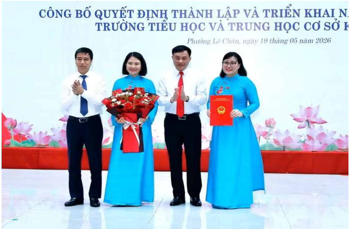
Thường trực Đảng ủy phường trao quyết định và tặng hoa chúc mừng nhà trường

Hội nghị tiếp tục công bố quyết định về thành lập tổ chức đảng Trường Tiểu học và Trung học cơ sở Kênh Dương. Cụ thể, Chi bộ Trường Tiểu học và Trung học cơ sở Kênh Dương là chi bộ cơ sở trực thuộc Đảng ủy phường Lê Chân gồm 12 đảng viên.