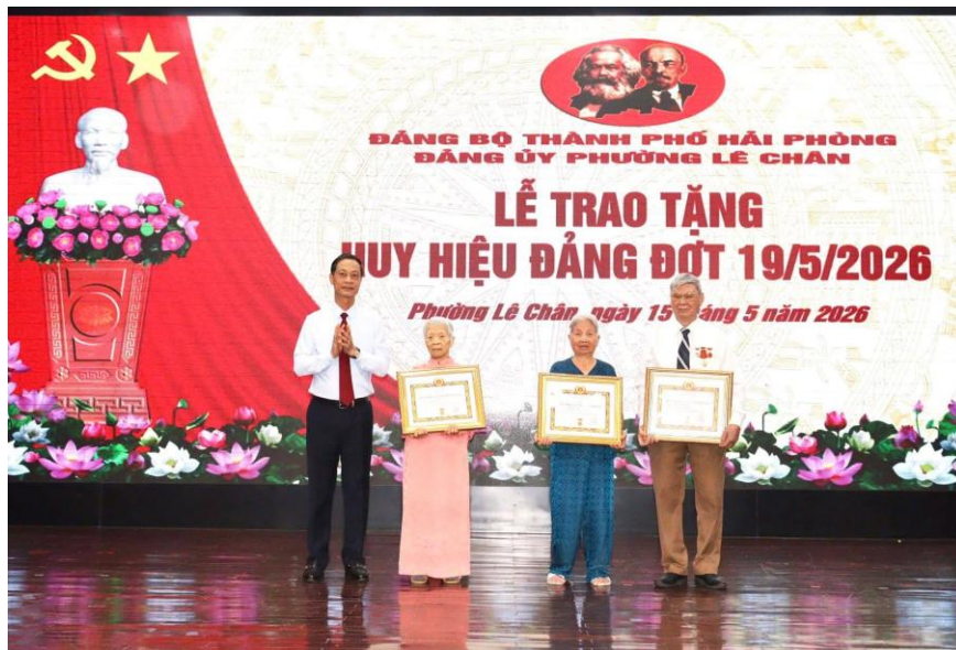
Đ/c Đỗ Mạnh Hiến - Phó Bí thư Thường trực Thành ủy trao Huy hiệu Đảng cho đảng viên

Chiều ngày 15/5/2026, Đảng ủy phường Lê Chân trang trọng tổ chức Lễ trao tặng Huy hiệu Đảng đợt 19/5/2026 - sự kiện chính trị có ý nghĩa sâu sắc, ghi nhận và biểu dương những đảng viên có nhiều năm cống hiến cho sự nghiệp cách mạng và công tác xây dựng Đảng.