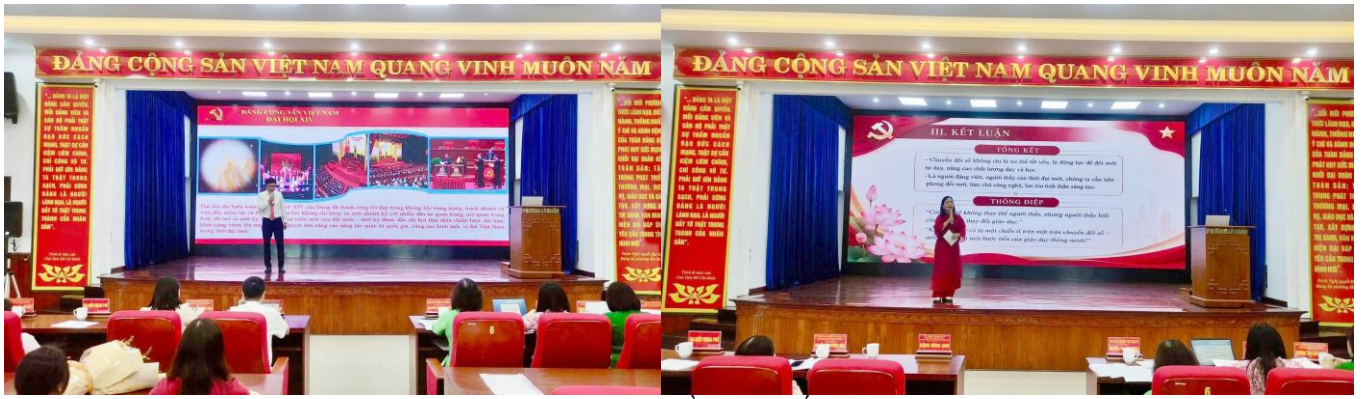
Các thí sinh tham gia phân thi thuyết trình

Tại Vòng Chung khảo, các thí sinh trải qua 02 phần thi gồm: Thuyết trình và Trả lời câu hỏi của Ban Giám khảo. Nội dung tập trung cụ thể hóa các Nghị quyết của Đảng gắn với thực tiễn cơ quan, đơn vị, địa phương; qua đó làm rõ vai trò của công tác tuyên truyền trong tình hình hiện nay. 05 thí sinh đã mang đến Hội thi nhiều bài thuyết trình chất lượng, liên hệ thực tiễn phong phú, được thể hiện bằng hình thức sáng tạo, nhiều màu sắc. Kết thúc Hội thi, Ban Tổ chức trao: