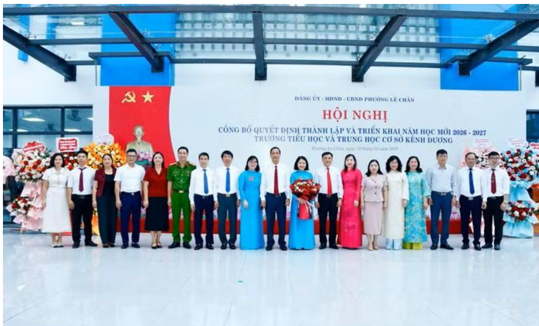
Đại biểu thành phố và phường chụp ảnh kỷ niệm cùng tập thể Ban Giám hiệu nhà trường

Không những vậy, nhà trường cần đặc biệt chú trọng xây dựng khối đoàn kết nội bộ, coi đây là nhân tố quyết định mọi thắng lợi. Mỗi thầy giáo, cô giáo phải là một tấm gương sáng về đạo đức, tự học và sáng tạo. Các thầy cô không chỉ dạy chữ mà phải dạy làm người, khơi dậy lòng nhân ái và trách nhiệm với cộng đồng trong mỗi học sinh. Hãy cùng nhau biến nơi đây thành một “Trường học hạnh phúc”, một “ngôi trường xã hội chủ nghĩa” đúng nghĩa - nơi mỗi ngày đến trường của thầy và trò đều là một ngày vui.