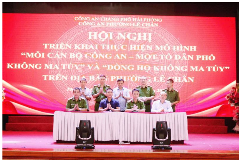
Mô hình “Mỗi cán bộ Công an – Một tổ dân phố không ma túy” và “dòng họ không ma túy”

- Phối hợp với các đơn vị, tổ dân phố triển khai hướng dẫn người dân trên địa bàn phường thực hiện cài số tay sức khỏe điện tử trên VNEID.