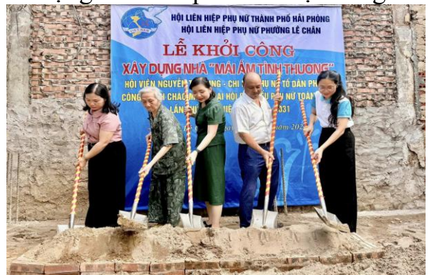
Công tác an sinh xã hội trên địa bàn phường được triển khai tích cực

* Công tác văn hoá - thông tin; thể dục - thể thao