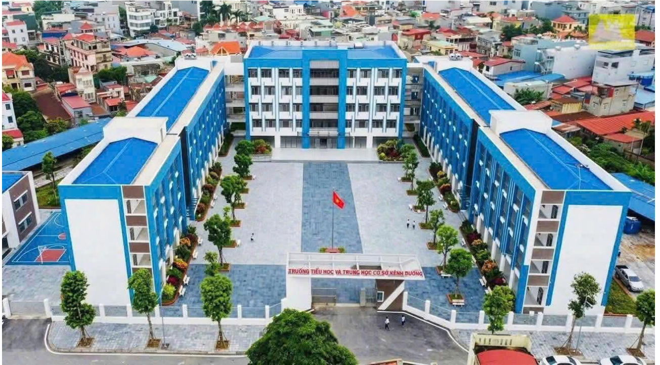
Quang cảnh Trường Tiểu học và Trung học cơ sở Kênh Dương