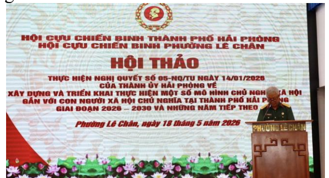
Hội Cựu chiến binh phường tổ chức hội thảo, thực hiện Nghị quyết số 05-NQ/TU của Thành ủy về "Xây dựng và triển khai thực hiện một số mô hình Chủ nghĩa xã hội gắn với con người Xã hội chủ nghĩa tại thành phố Hải Phòng" giai đoạn 2026 - 2030 và những năm tiếp theo

- Tiếp tục triển khai thực hiện hiệu quả Kết luận số 01-KL/TW ngày 18/5/2021 của Bộ Chính trị và thực hiện chuyên đề "Học tập và làm theo lời dạy của Chủ tịch Hồ Chí Minh về tiếp tục nâng cao đời sống Nhân dân và xây dựng Chủ nghĩa xã hội