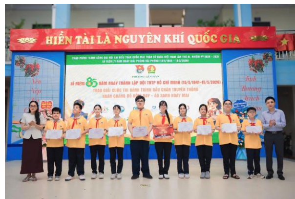
Các đồng chí lãnh đạo phường trao giải cho các em học sinh tham gia Cuộc thi Hành trình dấu chân truyền thống với chủ đề “Khăn quàng đỏ hôm nay - Áo xanh ngày mai”

Trong khuôn khổ chương trình đã diễn ra nội dung trao giải Cuộc thi Hành trình dấu chân truyền thống với chủ đề “Khăn quàng đỏ hôm nay - Áo xanh ngày mai”. Đây là sân chơi lành mạnh, bổ ích được Ban Thường vụ Đoàn - Hội đồng Đội phường phối hợp cùng Câu lạc bộ Phát triển cộng đồng thiếu nhi Hải Phòng nhằm khơi dậy niềm tự hào, ý thức phấn đấu của thiếu nhi, học sinh nhân dịp kỷ niệm 85 năm Ngày thành lập Đội; đồng thời góp phần nâng cao hiểu biết, rèn luyện kỹ năng, thúc đẩy phong trào thi đua học tập ngoại ngữ trong nhà trường.