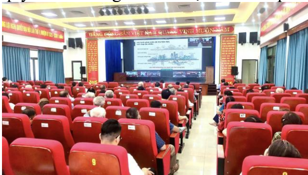
Trực tuyến Hội nghị Báo cáo viên Trung ương tháng 6/2026

- Tổ chức tiếp sóng trực tuyến Hội nghị quán triệt, tuyên truyền các Nghị quyết của Đảng tới cán bộ chủ chốt phường.