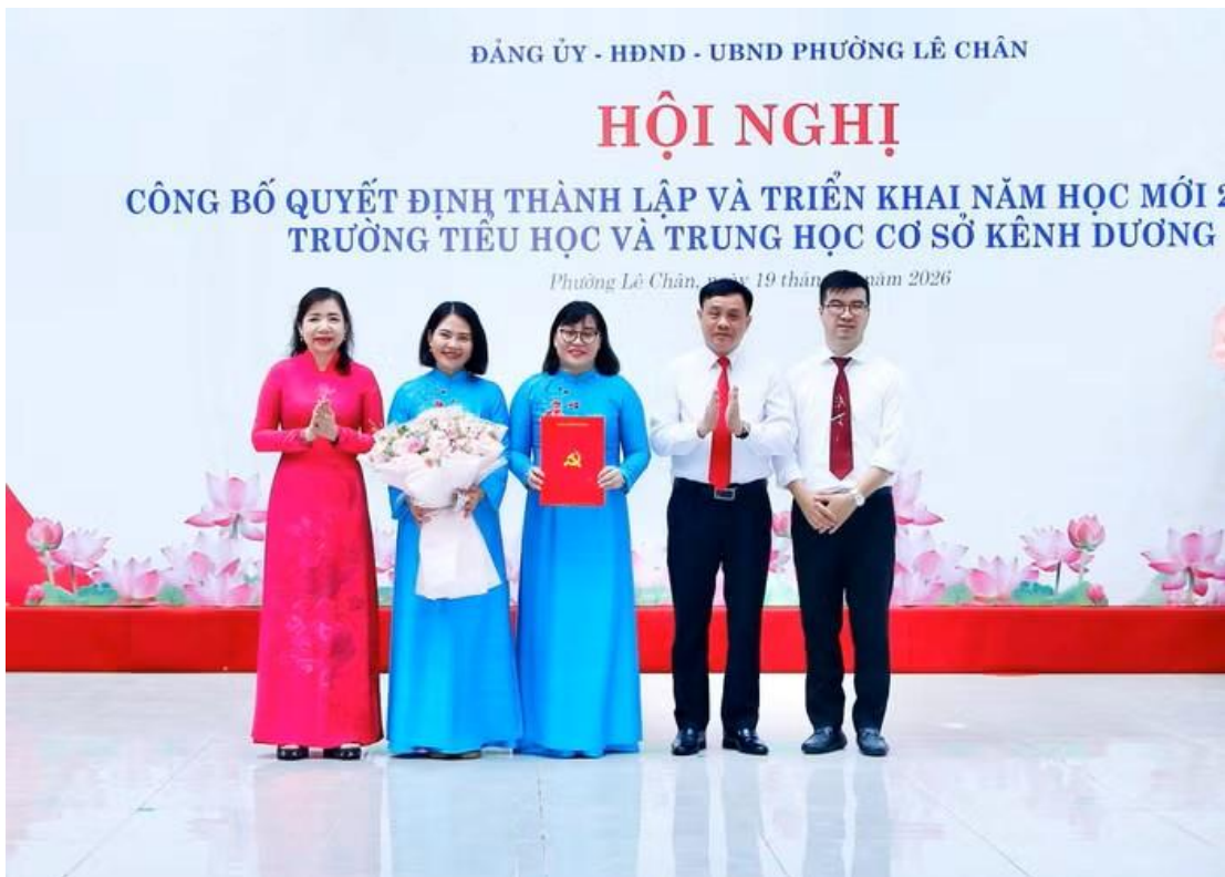
Thường trực Đảng ủy phường trao Quyết định và hoa chúc mừng Chi bộ nhà trường

Hội nghị tiếp tục công bố quyết định về thành lập tổ chức đảng Trường Tiểu học và Trung học cơ sở Kênh Dương. Cụ thể, Chi bộ Trường Tiểu học và Trung học cơ sở Kênh Dương là chi bộ cơ sở trực thuộc Đảng ủy phường Lê Chân gồm 12 đảng viên.