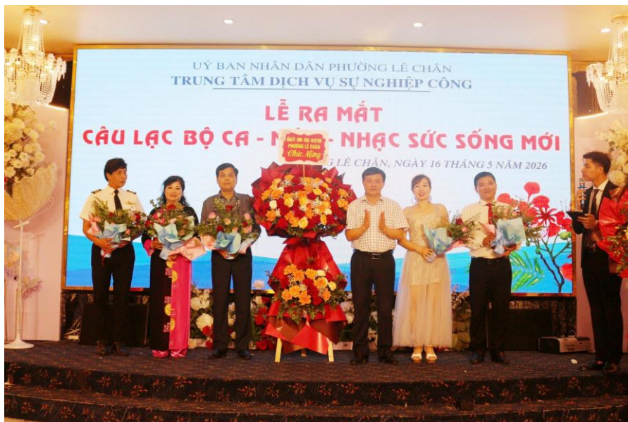
Ra mắt mô hình Dân vận khéo: Cầu lạc bộ Ca - Mùa - Nhạc Sức sống mới

- Ra mắt và tiếp tục triển khai thực hiện hiệu quả các mô hình “Dân vận khéo”.