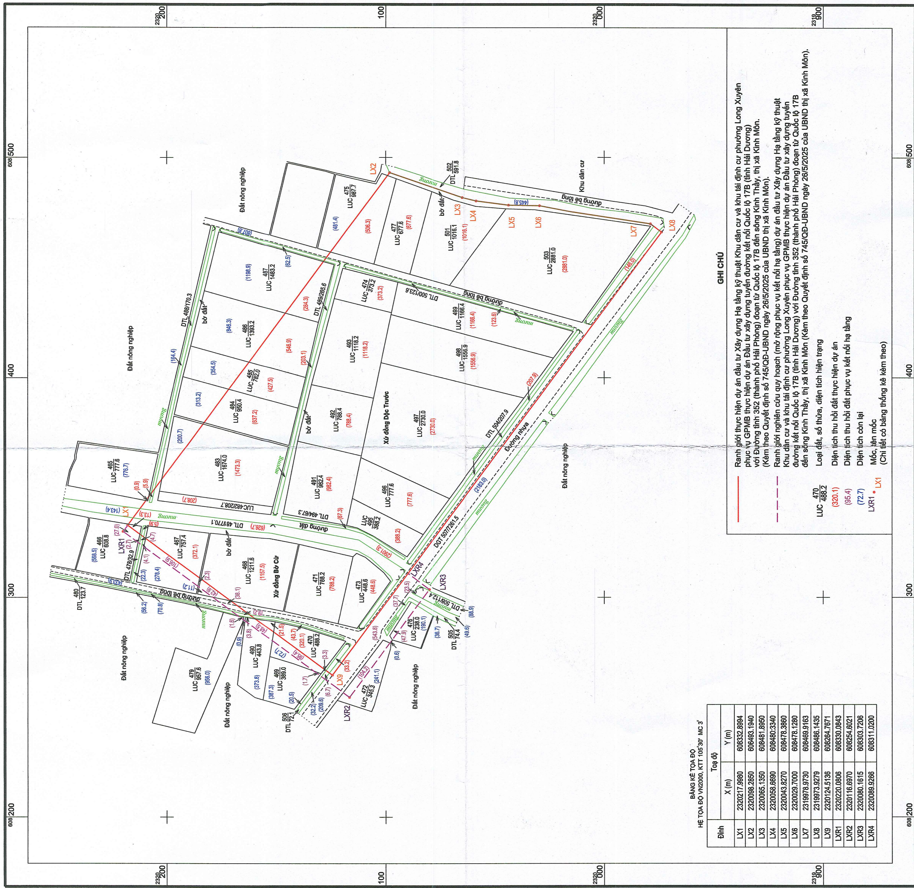
BẢNG KÊ TỌA ĐỘ