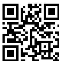
Video hướng dẫn liên kết Tài khoản ngân hàng với Etax Mobile