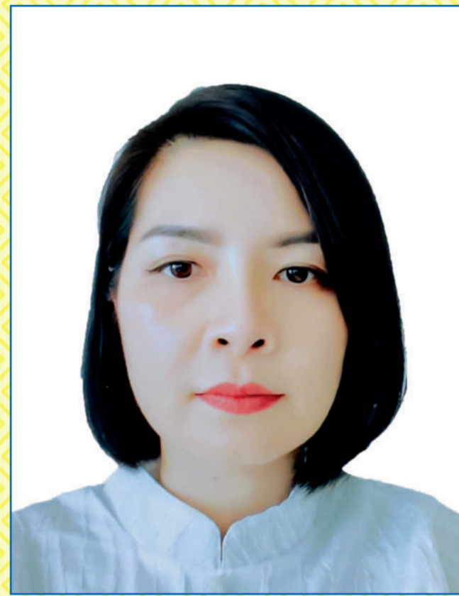
Bà HÀ THỊ HIỆN

Từ tháng 3/2025 - tháng 6/2025: Thẩm phán Tòa án nhân dân bậc 2, Ủy viên Ban Chấp hành Đảng bộ Các cơ quan Đảng tỉnh, Bí thư Đảng bộ, Chánh án Tòa án nhân dân tỉnh Vĩnh Phúc. Từ tháng 7/2025 đến nay: Thẩm phán Tòa án nhân dân bậc 2, Ủy viên Ban Chấp hành Đảng bộ thành phố, Bí thư Đảng ủy, Chánh án Tòa án nhân dân thành phố Hải Phòng./