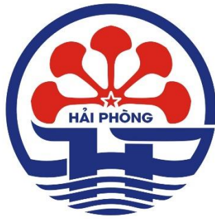
Hình 1. Mẫu in màu